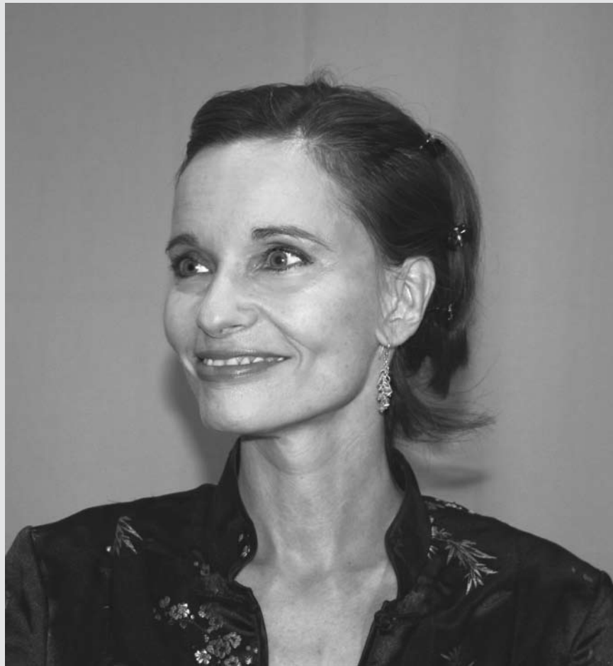
Foto: LG Öffentliches Recht, juristische Rhetorik und Rechtsphilosophie

Die rhetorische Betrachtungsweise führte Gräfin Schlieffen zu Analysen der juristischen Entscheidungsfindung und Entscheidungsbegründung. Die Analysen zeigen, erklärt sie, dass Recht nicht einfach durch „Anwendung“ von Gesetzen mit Hilfe der „Logik“ gefunden wird, wie gemeinhin gelehrt wird. „Die juristische Entscheidungsbegründung verläuft strukturell ähnlich wie wir im Alltag Kofferpacken: Da gibt es Dinge, die sind auf jeden