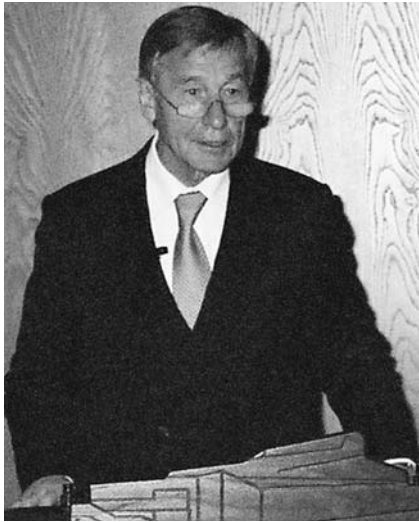
Wolfgang Clement sprach in Lüdenscheid